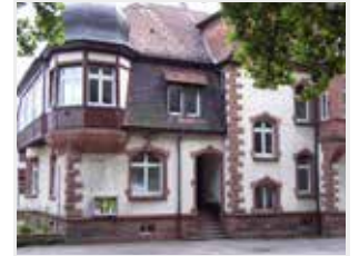
Heilpäd.Tagesgruppe Stefanienstraße 36