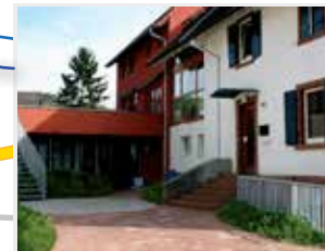
Gruppe 8 mit Verselbständigungsgruppe Ölgasse 16 Altmühlgasse 13/1