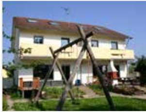
Gruppe 7 Kirchstraße 54-56