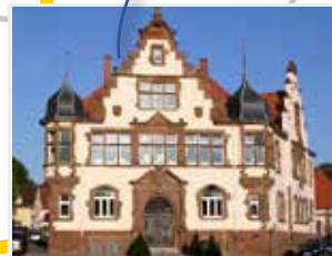
Heilpädagogisch therapeutisches Zentrum Außenklasse §35a Dinglinger Hauptstr. 54