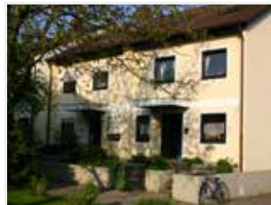
Gruppe 1+2 Am Lindenplatz 13+15