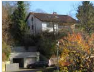
Gruppe 4 Bergstraße 146