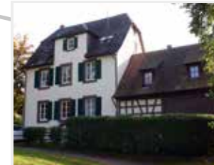
Gruppe 5 Außenklasse Ferdinand-Fingado-Schule Burgbühlstraße 8