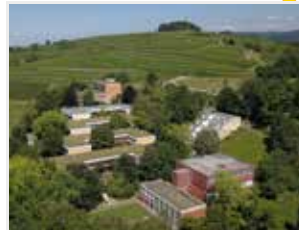
Zentrale mit Verwaltung Sprachheilzentrum Ferdinand-Fingado-Schule Leitung Jugendhilfe Reha-Ausbildung Technischer Dienst