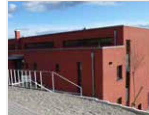
Gruppe 3 + 6 Weinbergstraße 5/3-5/4