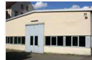
Malerwerkstatt und KFZ-Werkstatt Kaiserstraße 80