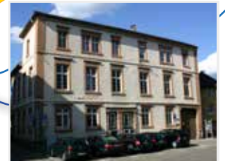
Lehrlingswohngruppe Bismarckstraße 19